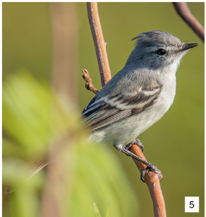
Figuras 2-5. Moscareta de Cresta Blanca ( Serpophaga subcristata ) en La Cachuela, Madre de Dios, el 18 de septiembre de 2023.