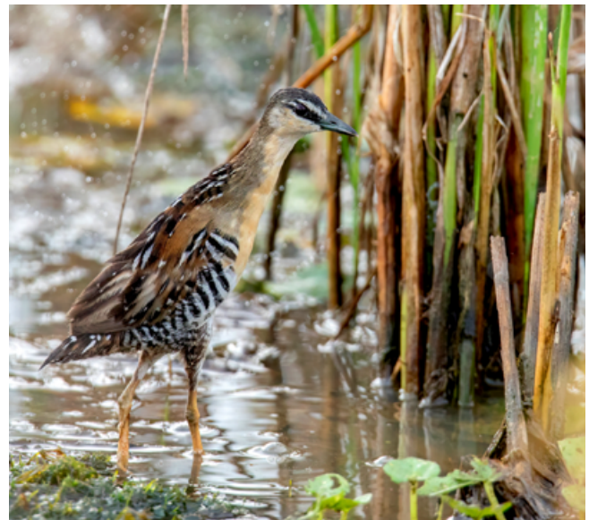
Figura 2 y 3. Gallineta de Pecho Amarillo ( Hapalocrex flaviventer ) en Bello Horizonte, Madre de Dios.