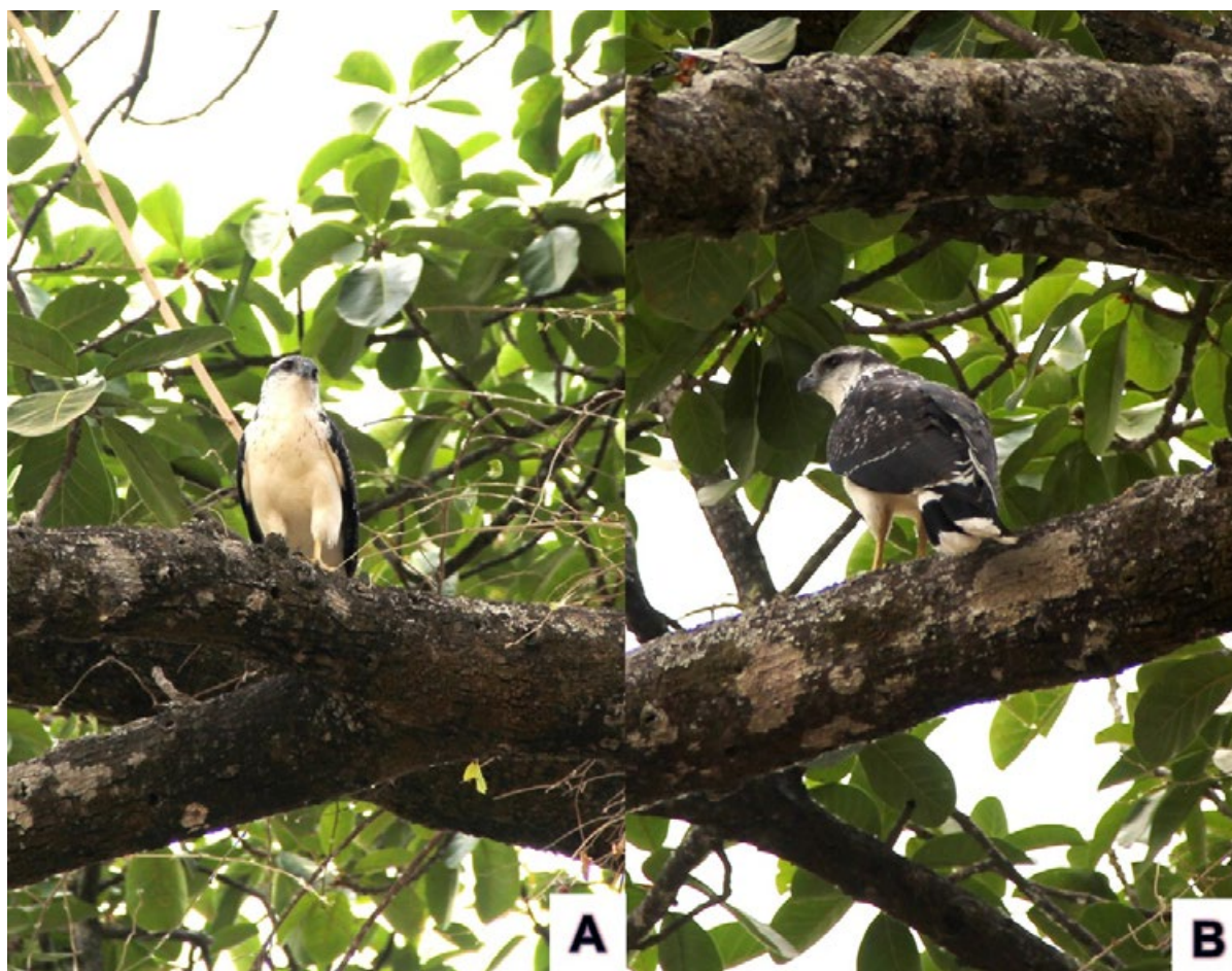
Figure 1. Pseudastur occidentalis en el bosque de Wuar Wuar, Suyo, Ayabaca, Piura. 1 de diciembre de 2016. A) Vista frontal. B) Vista dorsal.

Entre el 29 de noviembre y el 3 de diciembre de 2016 se realizó una evaluación de campo sobre la densidad de aves incluidas en los apéndices de la Convención sobre el Comercio Internacional de Especies Amenazadas de Fauna y Flora Silvestres (CITES) en el bosque de Wuar Wuar, distrito de Suyo, provincia de Ayabaca, departamento de Piura. Se evaluó tres transectos, dos de 3 km y uno de 1.5 km, entre las 7 h y 13 h. El primero de diciembre de 2016, a las 13 horas con 40 minutos, se observó y fotografió durante cinco minutos un individuo adulto de P. occidentalis perchado en un árbol de Ficus sp. (4°22'47.12"S/80°4'42.11"O, 446 m; Fig. 1A & B) a una distancia de 8 m aproximadamente del observador.