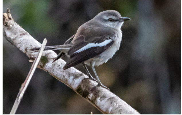
Fig. 14. Calandria de Ala Blanca / White-banded Mockingbird ( Mimus triurus ).

for Peru, with previous reports in CRAP (2015, 2016) and Cieza & Díaz (2014), with a fourth undocumented published record known (Sharlow & Sharlow 2004).