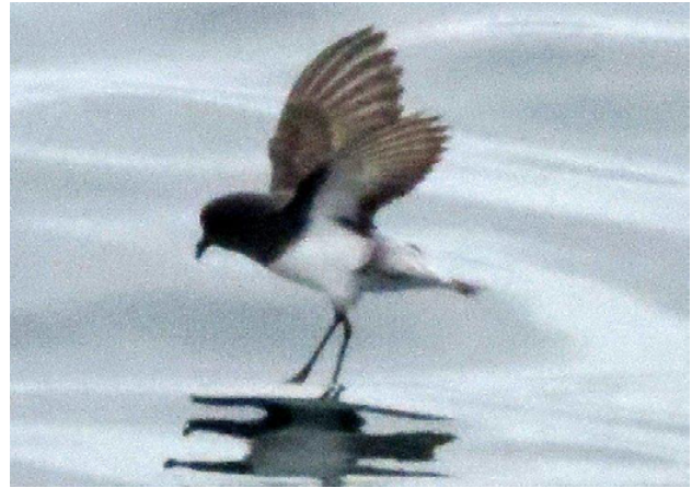
Fig. 5. Golondrina de Mar Subantártica / Gray-backed Storm-Petrel ( Garrodia nereis ).

On 21 August 2012, G. Engblom and others observed a Gray-backed Storm-Petrel ( Garrodia nereis ) along with around 10 Elliot's Storm Petrels ( Oceanites gracilis ) attending a South American Sea Lion ( Otaria flavescens ) carcass at sea about 12 nautical miles (NM) west of Callao, Constitutional Province of Callao (Fig. 5). A detailed description was provided previously to CRAP including details of why similar species were eliminated and a size comparison with the nearby Elliot's Storm Petrels and outlining the reasoning behind the identification. Unfortunately, additional photographic documentation was lost, but one photo was salvageable and was arguably clear enough to judge. The committee was unable to come to a quorum in the first round of votes, so the image was sent out for outside opinions. In 2020, with testimonials from at least 11 seabird experts from around the world agreed with the identification of Gray-backed Storm-Petrel. Given these comments and the existence of more literature and media to consult, the committee voted by a majority vote to accept the record with 6 YES votes, one NO and one abstention, representing the first record for Peru; it is accepted to the list of the birds of Peru as a vagrant.