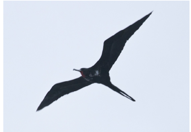
Fig. 9. Avefragata Grande / Great Frigatebird ( Fregata minor ).

On 17 March 2018, F. Schmitt and S. Howell, while guiding a tour, observed an immature Fregata minor at sea 171 NM from the Peruvian Coast off the Department of Arequipa ( 18^{\circ}43'14.52''S/75^{\circ}13'31.80''W , 0 m). One member of the tour group, D. Durda, obtained photos (Fig. 9). The photos and description were considered to match that species by the committee and the committee accepted this record unanimously, representing the first documented record for Peru; it is accepted to the list of the birds of Peru as a vagrant to Peruvian waters.