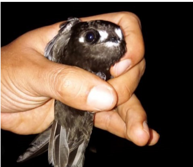
Fig. 2. Vencejo de Frente Punteada / Spot-fronted Swift ( Cypseloides cherriei ).

On 29 August 2018, at Los Llanos, Province of San Ignacio, Department of Cajamarca, (5°5'42.4248"S/78°52'10.38"W, 2163 m), P. Venegas hand-captured one of two Spot-fronted Swifts ( Cypseloides cherriei ) that had been roosting behind a narrow waterfall, Venegas photographed and released the bird, the resulting photographs allow a conclusive identification (Fig. 2). The committee accepted this record unanimously, representing the first confirmed record for Peru; it is accepted to the list of the birds of Peru as a breeding resident. The fact that the birds were captured by waterfalls suggests local nesting. Cypseloides swifts are famously difficult to identify, much less document, and the species may be more widespread in the country and is undoubtedly overlooked if so (much like White-chested Swift, C. lemosi , had been until recently).