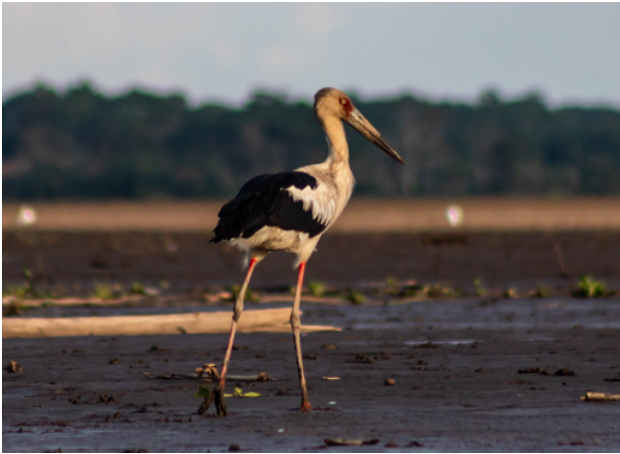
Fig. 8. Cigüeña Maguari / Maguari Stork ( Ciconia maguari ).