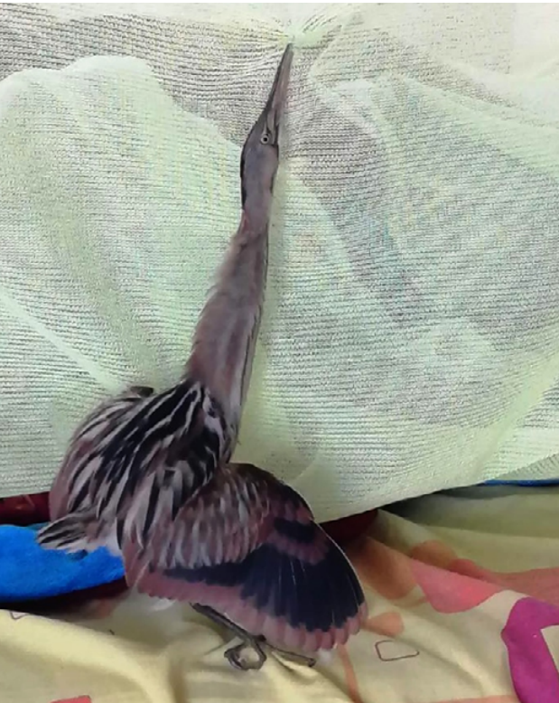
Fig. 10. Mirasol Listado / Stripe-backed Bittern ( Ixobrychus involucris ).

a rare austral migrant. This is the 2nd documented record for Peru. Kilby et al. (2018) reports 5 previous records for Peru, only one of which was submitted to CRAP. We would strongly suggest making all efforts to photo-document reports of Stripe-backed Bittern, and hope that observers will submit them to eBird and CRAP to help us assess the status of the species in the country.