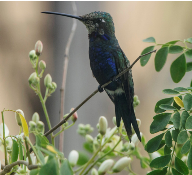
Fig. 3. Colibrí de Pecho Azul / Blue-tufted Starthroat ( Heliomaster furcifer ).