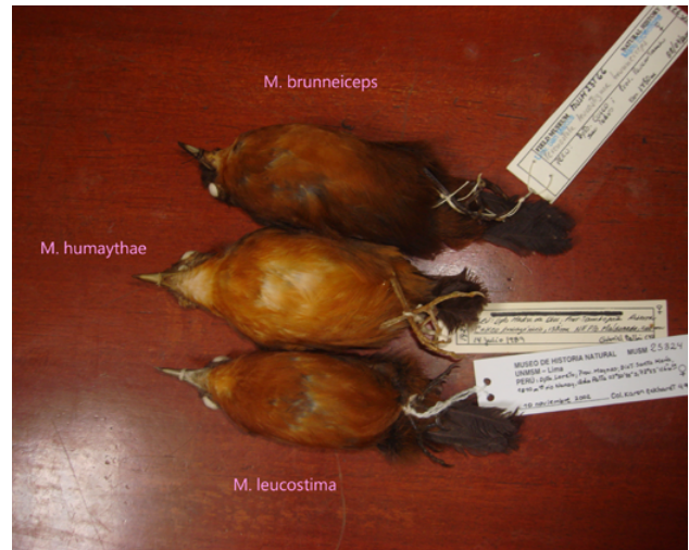
Fig. 22. Hormiguero de Humaita / Humaita Antbird ( Myrmelastes humaythae ).

After the split of Spot-winged Antbird ( Myrmelastes leucostigma ) (Isler et al. 2007), Humaita Antbird ( M. humaythae ) was known from outside of Peru, but its status inside the country was unclear. Schulenberg et al. (2010) considered the species to be a resident breeding bird in SE Peru north of the Manu and Madre de Dios rivers, but without evidence, Plenge (2020) maintained it as hypothetical. On 14 July 1989, a female Myrmelastes humaythae was netted at Cuzco Amazónico Lodge (now Inkaterra Reserva Amazónica) (12°32'25.55"S/69°3'9.68"O, 185 m), province of Tambopata, Madre de Dios. It was prepared as a museum specimen and deposited at the Museo de la Universidad Nacional de San Marcos (MUSM; catalog number MUSM 14296). Photographs comparing this individual with female specimens of Brownish-headed Antbird ( Myrmelastes brunneiceps ) and Myrmelastes leucostigma (Fig. 22) were submitted as evidence of the species' presence in the country. The committee accepted this record unanimously. With this specimen documentation, it is upgraded from Hypothetical to breeding resident on the Peruvian list.