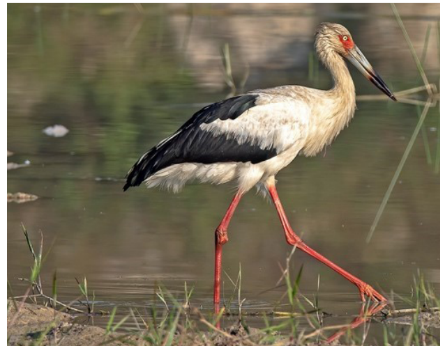
Fig. 7. Cigüeña Maguari / Maguari Stork ( Ciconia maguari ).

On 6 August 2020, N. Amable Silva observed and photographed a Maguari Stork ( Ciconia maguari ) with four Wood Storks ( Mycteria americana ) at Estancia de Ana Garrido, Province of Tambopata, Department of Madre de Dios (12°30'4.68"S/69°6'5.51"W, 200 m) (Fig. 7). The committee accepted this record by 7 YES votes as a vagrant with one member abstaining. This is the third documented record for Peru (see CRAP 2017 and this report).