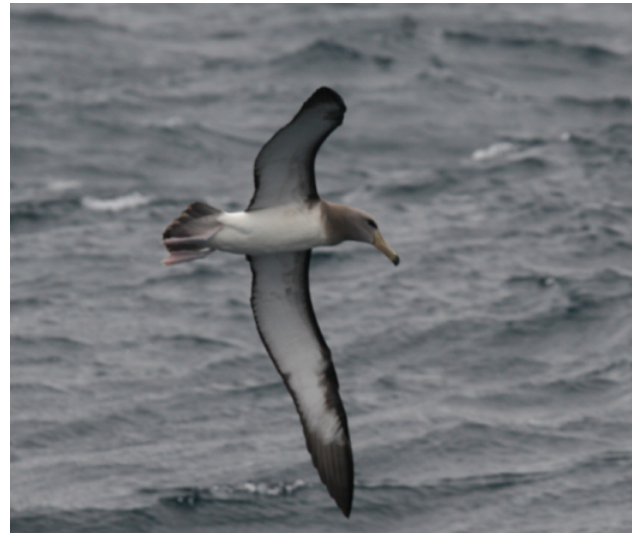
Fig. 18. Albatros de Chatham / Chatham Albatross ( Thalassarche eremita ).

This species has been considered Hypothetical on the list of the birds of Peru (Plenge 2020) and SACC, given the lack of documented records published or submissions to CRAP. On 08 August 2009, D. Lane and other observers saw and photographed (Fig. 18) a Chatham Albatross ( Thalassarche eremita ) in the Pacific Ocean approx. 30 km west of El Callao, Constitutional Province of El Callao. The species has been observed and documented now on several occasions (there are at least three other well-photographed records on eBird from Peruvian waters). The committee accepted this record unanimously, moving it onto the main list of the birds of Peru as a regular non-breeding visitor to Peruvian waters.