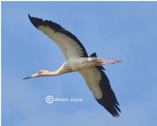
Fig. 6. Cigüeña Maguari / Maguari Stork ( Ciconia maguari ).