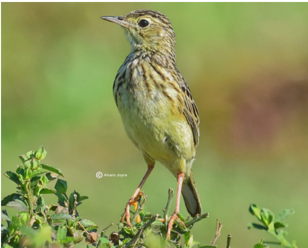
Fig. 15. Cachirla Amarillenta / Yellowish Pipit ( Anthus chii ).

obtaining a conclusive photo of one (Fig. 15). The committee accepted this record unanimously. This is the second record with evidence submitted and accepted by the committee, after CRAP (2020) (up until 2021, the species' scientific name was Anthus lutescens , but SACC 2021 provided reasoning to change it to A. chii ); we consider this species to be a resident breeding bird in SE Peru.