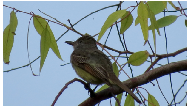
Fig. 12. Copetón Viajero / Great-crested Flycatcher ( Myiarchus crinitus ).

On 15 January 2020, J. Murphy observed and photographed a Myiarchus flycatcher in a small group of Eucalyptus trees beside a drainage canal surrounded by pasture at the Laguna Marvilla, Pantanos de Villa wildlife refuge (12°13'13.74"S/76° 59'12"W, 3 m), Department of Lima. (Fig. 12). Murphy immediately narrowed the identification down to either Brown-crested Flycatcher ( Myiarchus tyrannulus ) or Great-crested Flycatcher ( M. crinitus ) being familiar with both species and later examining the photos and consulting with a committee member, he agreed it was the latter. This was in the same group of trees where Peru's second record was recorded 13 years previously! The committee accepted this record based on the solid description and photos by a majority vote with 5 votes in favor, 2 against and one abstention. This constitutes the 4th documented record for Peru with third reported on CRAP (2016); the species continues on list of the birds of Peru as a vagrant.