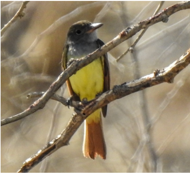
Fig. 13. Copetón Viajero / Great-crested Flycatcher ( Myiarchus crinitus ).