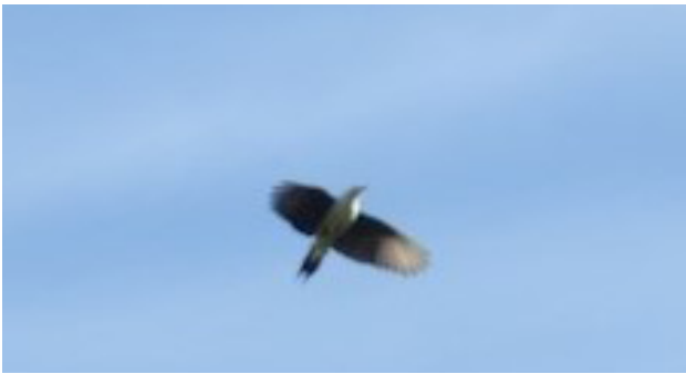
Fig. 20. Carpintero Blanco / White Woodpecker ( Melanerpes candidus ).

22 August 2018, when R. Flores Raymondi photographed one of three birds in flight (Fig. 20) on the Pampas del Heath, Province of Tambopata, Department of Madre de Dios (12°57'24.26"S/68°55'8.39"W, 208 m). The committee accepted this record unanimously considering the photo to be conclusive. The species is moved onto the main list of the birds of Peru as a vagrant for now, documenting future observations is desirable to change the species' status in the country.