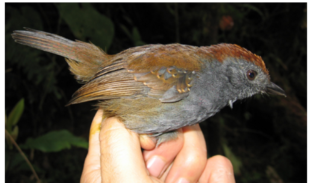
Fig. 21. Batarito Bicolor / Bicolored Antvireo ( Dysithamnus occidentalis ).

On July 15 2006, a pair were mist netted 2 km WSW from Hito Jesús, Province of San Ignacio, Department of Cajamarca (4°53'40"S/78°54'54"W, 1800 m) by a Louisiana State University Museum of Natural Science (LSUMZ) expedition, in a mosaic of tall humid subtropical forest and pastures with cattle. The birds were photographed (Fig. 21) and the female is deposited at LSUMZ (catalog number LSUMZ 179006). A more in-depth discussion of the status of the species in Peru underway, and will be published elsewhere (S. Crespo, pers. comm.). The committee accepted this submission by a majority with 7 YES votes and 1 NO vote. The species is moved onto the main list of the birds of Peru as a resident breeder.