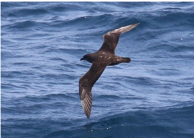
Fig. 19. Petrel de Kermadec / Kermadec Petrel ( Pterodroma neglecta ).

There are other eBird records, some well-photographed, from Peruvian waters. Based on this present record, coupled with previous photos (Fig. 19) submitted of this species to CRAP of the underparts by F. Schmitt, G. Rosenberg and J. Drucker, the committee accepted this record by a majority with 6 YES votes and two abstentions. The species is moved onto the main list of the birds of Peru as a regular non-breeding visitor to Peruvian waters.