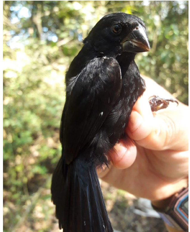
Fig. 17. Semillero de Pico Grueso / Thick-billed Seedfinch ( Sporophila funerea ).

and accepted this record unanimously and considers the species a vagrant given the lack of further records. It represents the first confirmed record for Peru.