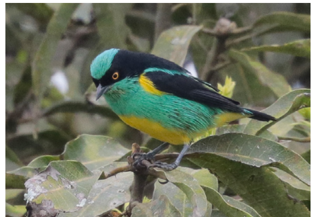
Fig. 16. Dacnis (de Pecho Amarillo) de Cara Negra / Black-faced (Yellow-tufted) Dacnis ( Dacnis lineata aequatorialis ).

On 27 July 2019, C. Bollatty Bedregal observed and photographed an adult male of the subspecies aequatorialis of Dacnis lineata at Estación Policial Cabo Cotrina in the Cerros de Amotape National Park, Province of Zarumilla, Department of Tumbes, (50°27.9"S/80°09'39.2"W, 720 m) (Fig. 16). Subspecies aequatorialis , together with the Colombian egregia , are considered by some authorities to be a separate species ( D. egregia ) from the Amazonian D. lineata (Ridgely & Greenfield 2001, Gill & Donsker 2020). The committee accepted this record unanimously and considers this taxon a vagrant for now, but anticipates that it might be a resident for which additional observations are necessary. This represents the second accepted record, the first being in CRAP (2020), and the first with documentation.