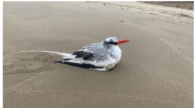
Fig. 4. Ave del Trópico de Pico Rojo / Red-billed Tropicbird ( Phaethon aethereus ).

The committee accepted this record by 7 YES votes, with one member abstaining, representing the first documented record confirmed by CRAP for Peru; it is accepted to the list of the birds of Peru as a vagrant to Peruvian waters. There are many unconfirmed records, some with photos, that have not been submitted to the committee.