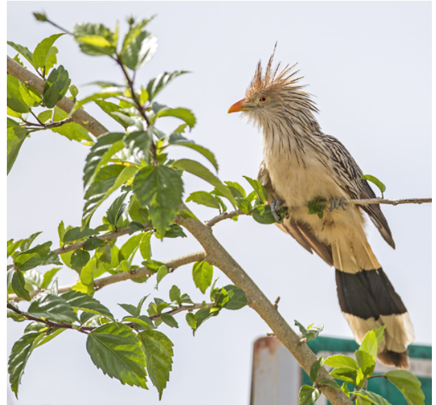
Fig. 1. Cuclillo Guira / Guira Cuckoo ( Guira guira ).

(12°35'28.01"S/69°11'22.75"W, 200 m). The photos and description are conclusive and the committee accepted this record unanimously. This constitutes the 2nd accepted record for Peru, after CRAP (2019).