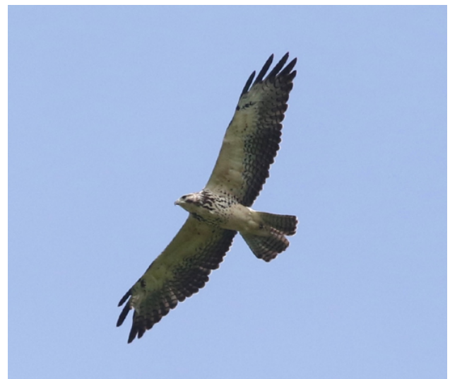
Fig. 11. Aguilucho de Swainson / Swainson's Hawk ( Buteo swainsoni ).

On 14 November 2017, E. W. Heisey observed and photographed (Fig. 11) a flying immature Swainson's Hawk ( Buteo swainsoni ) over an open field near forest edge at Finca las Piedras, Province of Tambopata, Department of Madre de Dios, (12°13'23.59"S/69°6'45.43"W, 200 m). The committee considered the evidence presented sufficient and accepted this record unanimously, representing the 2nd documented record for Peru (the first was reported in CRAP 2020); the species continues to be considered a vagrant.