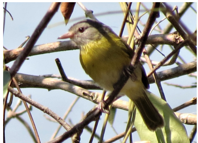
Fig. 25. Verdillo de Cabeza Ceniza / Ashy-headed Greenlet ( Hylophilus pectoralis ).

near Juan Guerra on 11 September 2012. One individual was mistnetted at the Concession de Conservación Ojos de Agua, Pucacaca (06°50'10.73"S/76°27'36.49"W, 450 m) and published with photos (Vásquez-Arévalo et al. 2018) (Fig 25). There are many other records on and off eBird. The committee accepted unanimously votes that the species should be moved onto the main list of the birds of Peru as a resident breeder.