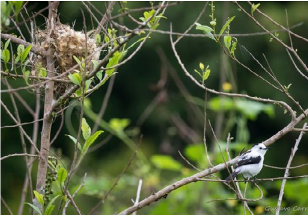
Fig. 23. Tirano-de-Agua Blanco y Negro / Pied Water-Tyrant ( Fluvicola pica ).

nesting behavior for approximately 30 minutes, documented with photos and video (Fig. 23). The committee accepted this submission unanimously and the species is moved onto the main list of the birds of Peru as a resident breeder.