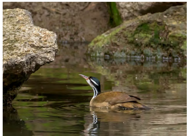
Figura 1. Heliornis fulica registrado en Machu Picchu pueblo el 5 de noviembre de 2015.

El 25 de noviembre de 2015, un individuo de la misma especie fue visto y fotografiado por Néstor Ccayca en la Laguna de Piuray, Chincheros (13°24'57.25"S / 72° 2'15.30"O, 3700 m). Este registro fue publicado el