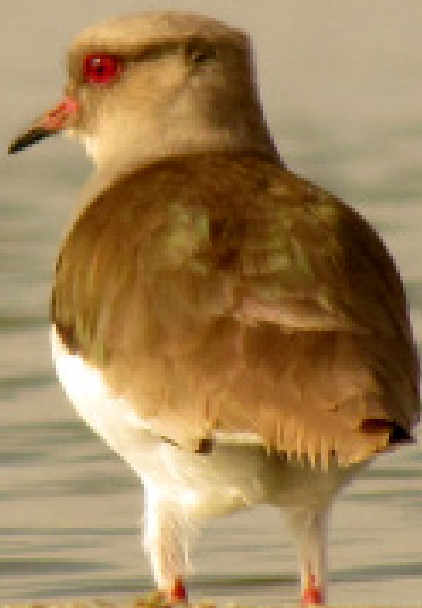
Avefría Andina ( Vanellus resplendens).