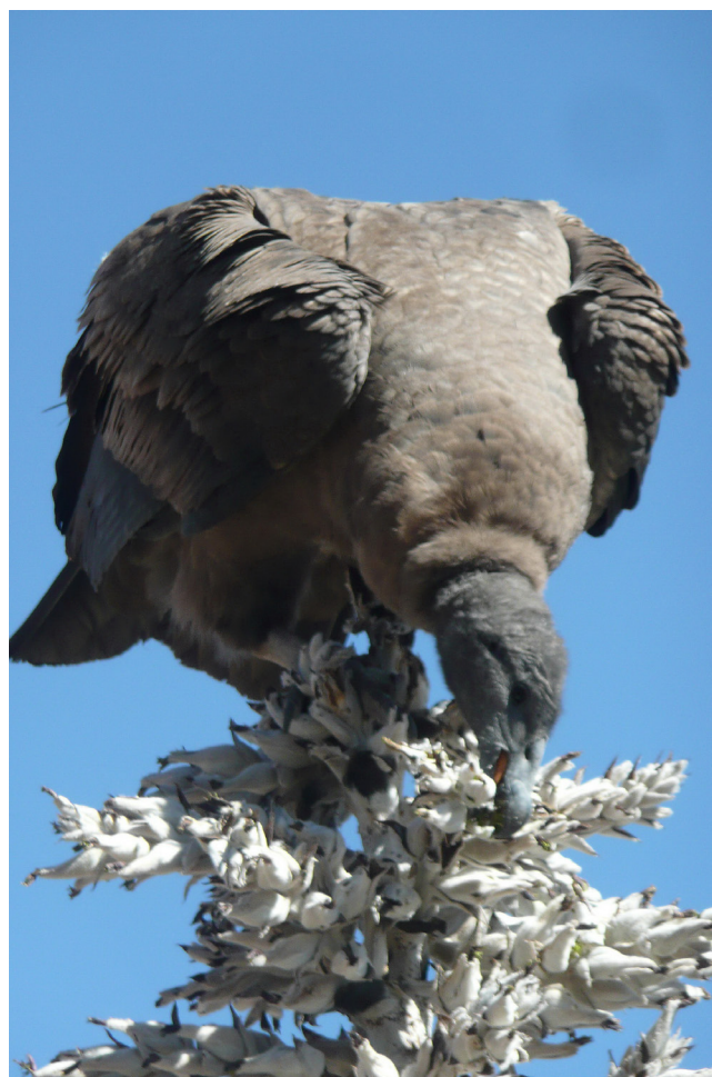
Figura 2: Observación del uso de la lengua del Cóndor Andino ( Vultur gryphus ) al forrajear una Puya ( Puya cylindrica ).