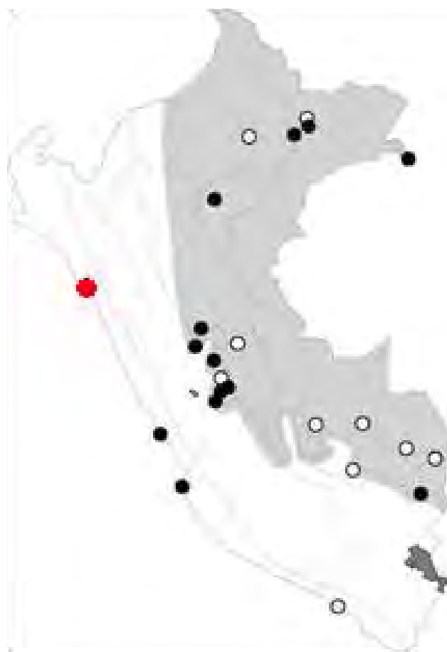
Mapa 01. Distribución de B. platypterus en Perú, según Schulenberg et al. (2006). El punto rojo indica la zona de nuestros registros. Los puntos negros señalan los lugares donde existen registros documentados y los puntos blancos indican los registros no documentados.