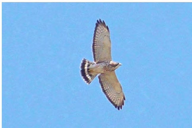
Figura 2. Individuo de B. platypterus sobrevolando la UNT.

El 25 de noviembre de 2010, Luis Pollack (LP) observó dos individuos sobre la zona norte del campus de la UNT. Uno de ellos se encontraba volando y el otro estaba perchedo sobre una rama alta de Eucalipto ( Eucaliptus globulus ) ubicado al lado del pabellón de la escuela de Ciencias Biológicas. La observación fue hecha desde el cuarto nivel del edificio, lo cual permitió al observador ubicarse a una distancia aproximada de 10 m del ave que se encontraba percheda (Figura 1). El primer individuo estuvo planeando en círculos y vocalizando de manera continua.