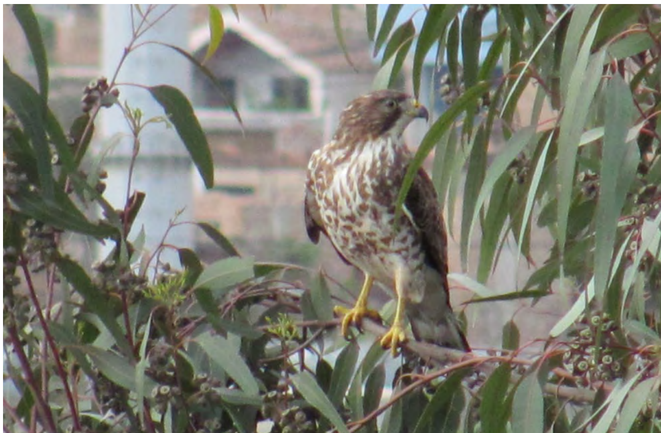
Figura 1. Individuo de B. platypterus perchado sobre Eucalyptus globulus .

Entre los años 2010 y 2013 realizamos numerosos registros de B. platypterus en la ciudad de Trujillo. Las observaciones realizadas en estos años consecutivos nos hacen pensar que B. platypterus podría estar utilizando la ciudad de Trujillo como lugar de estadía durante sus migraciones.