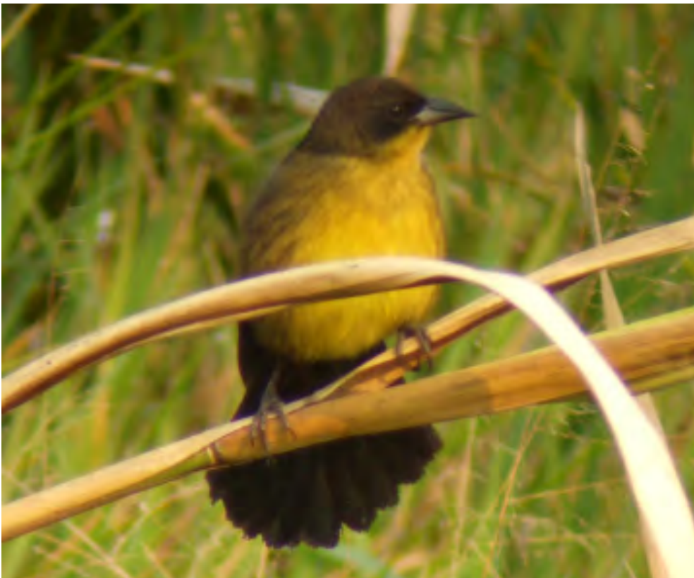
Fig. 7 & 8: Agelasticus cyanopus ; Tordo Unicolor; Unicolored Blackbird.

Votes were 10 Yes, 00 No, 01 Abstentions. The species was added to the Peru list.