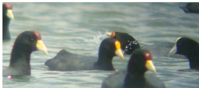
Fig. 5 & 6: Fulica leucoptera ; Gallareta de Frente Amarilla; White-winged Coot.