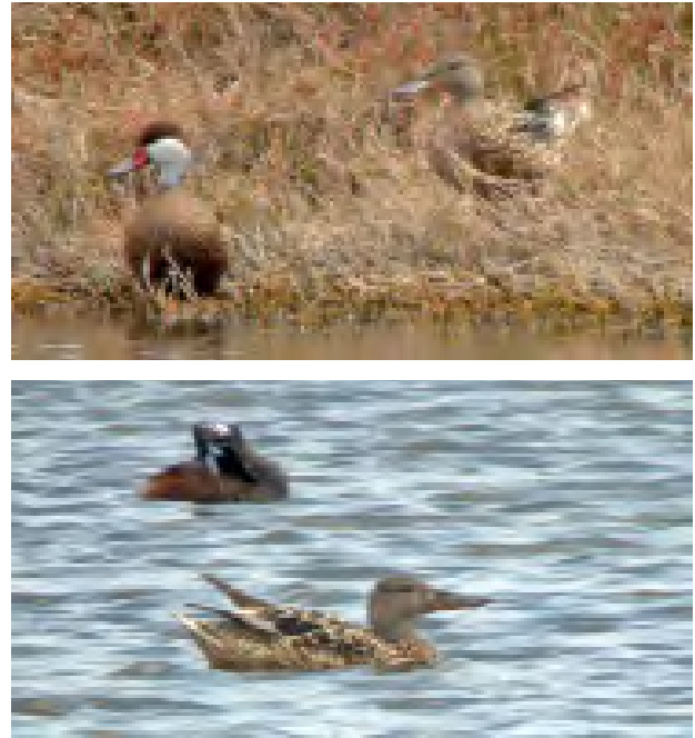
Fig. 1 & 2: Anas clypeata ; Pato Cuchara Norteño; Northern Shoveler.

La inclusión de esta especie en la lista de aves de Perú fue aprobada con nueve votos a favor, ningún voto en contra y dos abstenciones.