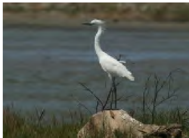
Fig. 3 & 4: Egretta rufescens ; Garcita Rojiza; Reddish Egret.